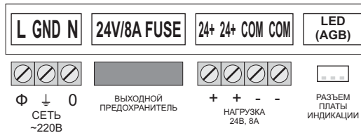
Рис. 1 Схема монтажная.