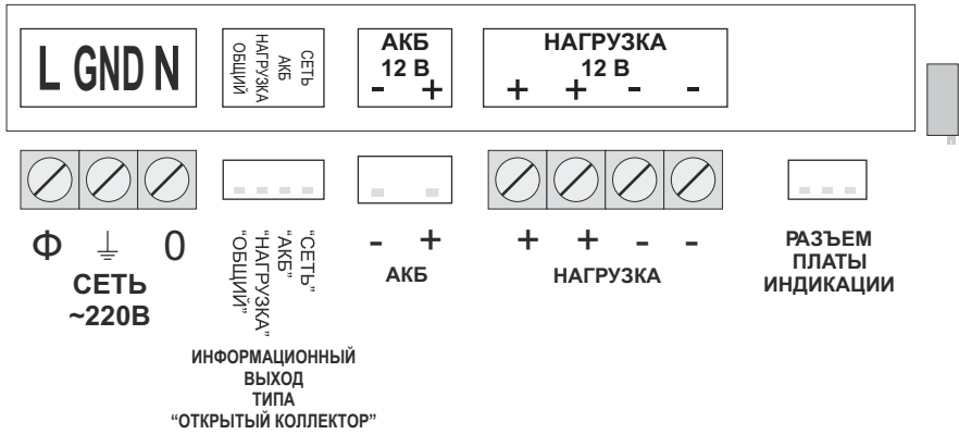
СХЕМА ИНФОРМАЦИОННОГО ВЫХОДА